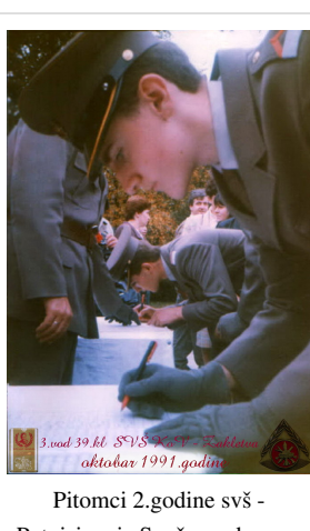
Pitomci 2.godine svš - Potpisivanje Svečane obaveze