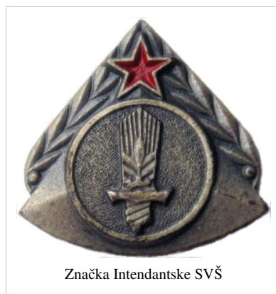
Značka Intendantske SVŠ