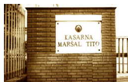
Kapija broj 4 kasarne „Maršal Tito“ Sarajevo - 1981. godine