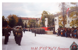
Svečanost u kasarni „Maršal Tito“ Sarajevo - 1990. godine