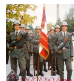
Zastavni pitomački vod u kasarni „Maršal Tito“ Sarajevo - 1990. godine