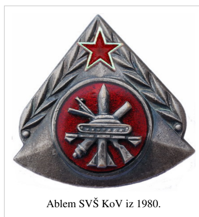
Abblem SVŠ KoV iz 1980.