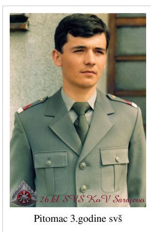
Pitomac 3.godine svš

Tokom školovanja, pitomci su unapredjivani u pitomačke činove. Nakon uspešno završene prve školske godine unapredjivani su u prvi pitomački čin, pitomac-razvodnik, nakon druge godine u pitomac-desetar, nakon treće u pitomac-mladji vodnik. Posle završenog školovanja, pitomci su proizvodjeni u čin aktivnog vodnika odgovarajućeg roda, odnosno službe i rasporedjivani su na dužnosti komandira: odeljenja, voda, karaule, rukovodioca, upravnika i slične dužnosti u jedinicama i ustanovama JNA. Pitomci koji su postizali odličan uspeh, ukoliko su ispunjavali i druge propisane uslove, mogli su odmah nastaviti školovanje u vojnoj akademiji. Ostali pitomci, zavisno od uslova koji su se propisivali svake godine, mogli su konkurisati za redovno ili vanredno školovanje u vojnoj akademiji rodova KoV i intendantske službe. Svečane promocije u čin vodnika, su se održavale sredinom jula meseca u Sarajevu, gde su se ponovo okupljali (kao na početku školovanja) pitomci iz svih vojno-nastavnih centara odakle su odlazili na prve dužnosti širom Jugoslavije.