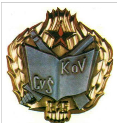
Grb Centra vojnih škola KoV Sarajevo