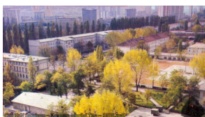
Panorama kasarne „Maršal Tito“ Sarajevo - 1976. godine