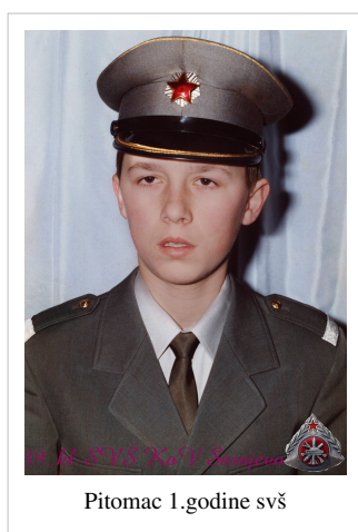
Pitomac 1.godine svš