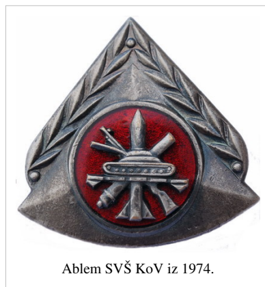
Abblem SVŠ KoV iz 1974.

Prve klase su imale dvogodišnje školovanje, sa 6. klasom počinje trogodišnje, a sa 17. klasom (od 1968. godine) počinje četvorogodišnje školovanje u koju su se upisivali učenici osmog razreda. Od 1979. godine, pored četvorogodišnjeg školovanja, ponovo je uvedeno dvogodišnje školovanje u koje su se upisivali učenici nakon završenog 2.razreda srednje civilne škole, tj. usmerenog obrazovanja, kako se tada zvalo. Te klase su pored broja klase imale i oznaku „A“. SVS KoV je bila izabrana na nivou JNA za eksperimentalnu savremenu skolu, zahvaljujući čemu je dobijala dodatna sredstva za najmodernija učila i za kontinuiranu dodatnu obuku nastavnog kadra. Tako je bila prva škola koja je imala televiziju zatvorenog kruga za primenu u nastavi, prva koja je imala tzv. programiranu učionicu i druga pomoćna nastavna sredstva koja su bila na nivou najsavremenijih škola u svetu. Imala je i impresivnu biblioteku. Istovremeno, godinama je saradjivala sa Filozofskim fakultetom u Sarajevu - Odsek pedagogija, koji je naučno rukovodio obukom nastavnog kadra u metodici i pedagogiji. Srednja vojna škola KoV je bila sastavni deo Centra vojnih škola KoV Sarajevo.